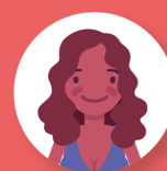
Fatiha, 43 ans

Aujourd'hui, son état de santé ne lui permet plus d'exercer son métier.